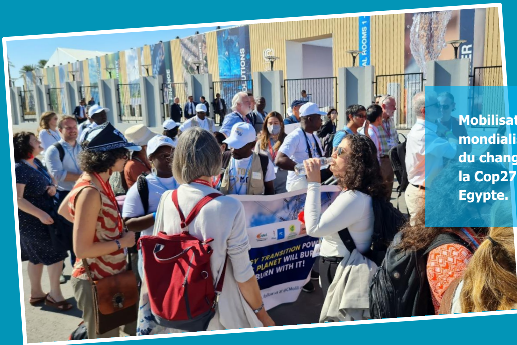
Mobilisation des alter mondialistes sur les enjeux du changement climatique à la Cop27 à Sharm El Sheik en Egypte.

Concernant la transition énergétique, nous avons beaucoup plus abordé le cas de la RDC qui s'est actuellement bien positionnée au niveau global comme "pays" solution au changement climatique, grâce au bassin du congo, sa forte et stratégique minerais. Nous avons pour ce faire démontré que l'hydrogène produit par les grands barrages ne peut pas être vert, à cause de multiples impacts sur les vies des communautés à savoir les délocalisations, sur la biodiversité avec la disparition des espèces aquatiques, la perte des moyens de subsistance ;