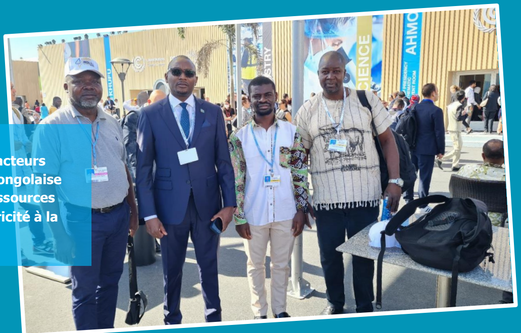
Rencontre entre les acteurs de la Société Civile congolaise et le Ministre des Ressources Hydraulique et Electricité à la Cop27