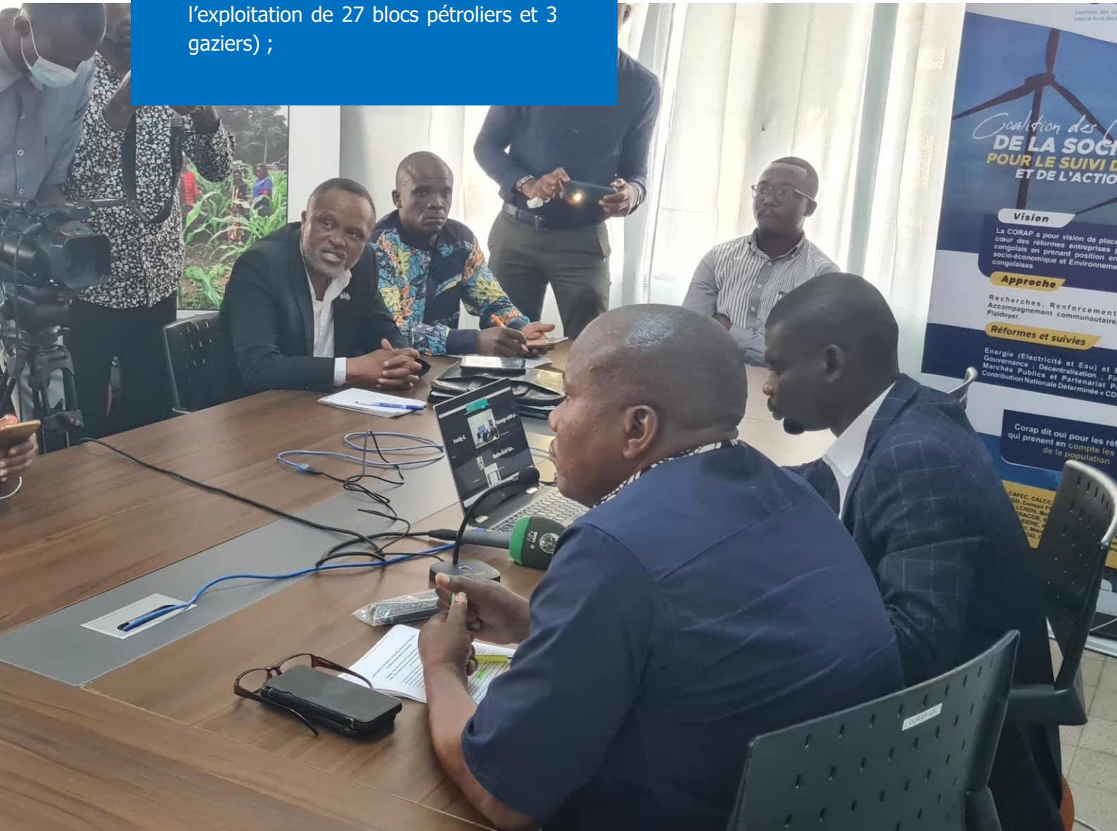
Plaidoyer sur les hydrocarbures (lancement des appels d'offres pour l'exploitation de 27 blocs pétroliers et 3 gaziers) ;