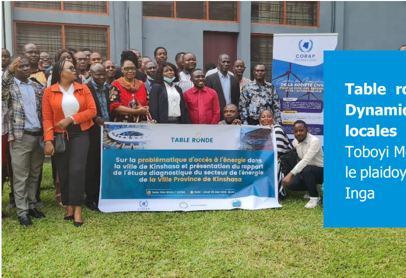
Table ronde entre les membres de la Dynamique PÔLE et les communautés locales d'Inga, membres de la coalition Toboyi Molili pour le partage d'information sur le plaidoyer autour de la PNE et le projet Grand Inga